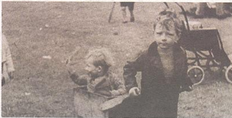
Кадар из филма "Дух '45" Кена Лоуча

Кратку рецензију или осврт на филм у слободној форми, не дужијој од 3.000 карактера, заједно са контакт подацима, током трајања турнеје заинтересовани могу послати на емаил адресу: recenzija@freezonebelgrade.org . Рок за слање радова је 20. јун 2014. године.